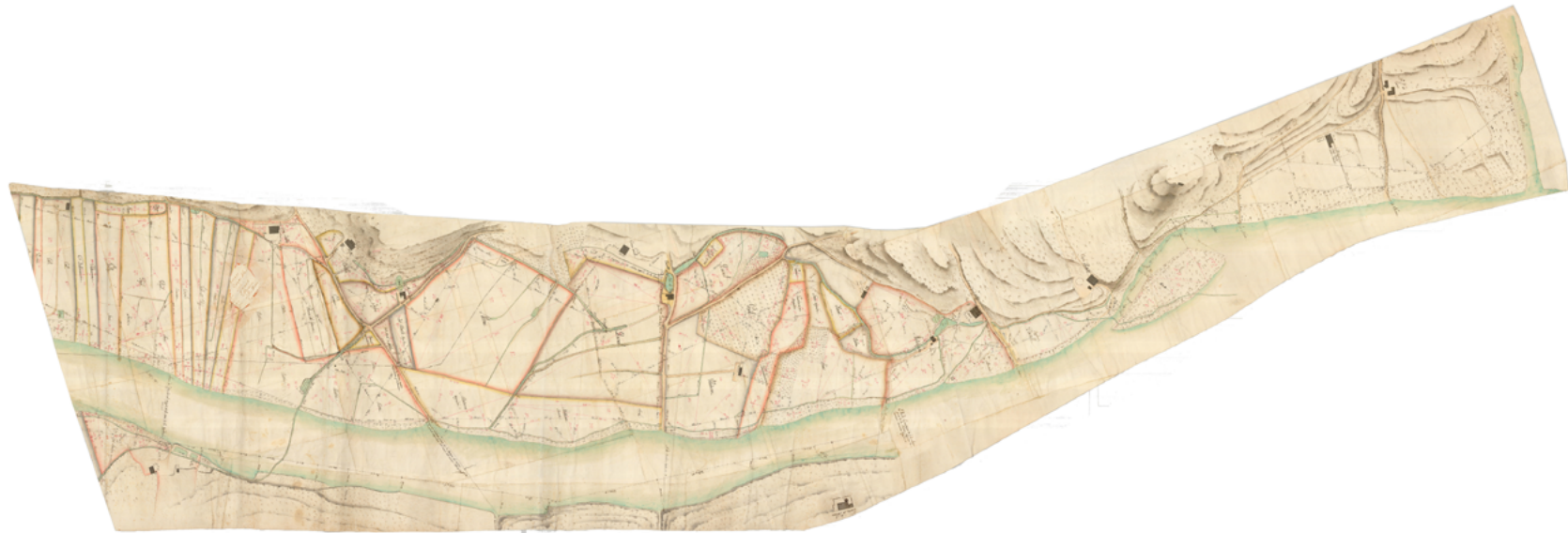
Soler i Ferrer, Tomàs. Plan geométrico de las tierras situadas en los términos de Argentona y Cabrera... , c.1820. AG-013213.